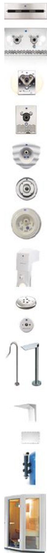
Jet Stream Bambo 2